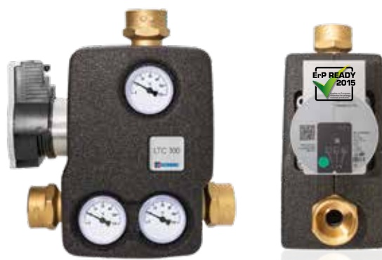
ŘADA LTC341 , Vnitřní závit s elektronickým čerpadlem, 4 m