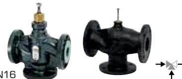
VLA335, VLB335 3-cestný regulační ventil PN16