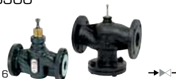
VLA325, VLB325 2-cestný regulační ventil PN16