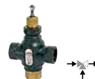
VLA131 3-cestný regulační ventil PN16