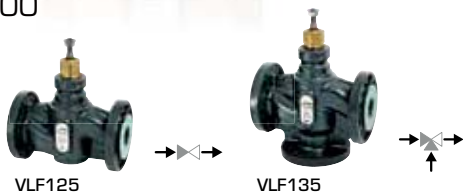
VLF125 2-cestný regulační ventil PN6